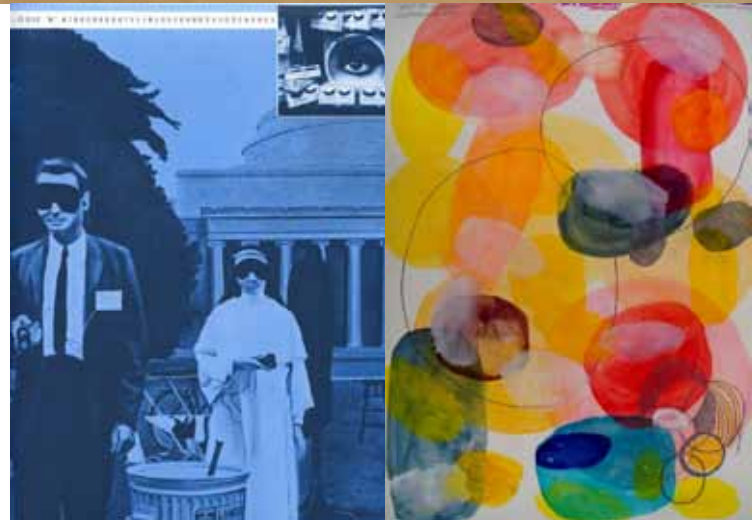
Ci-contre, de Haut en bas et de gauche à droite : photographie de V.Hubert, gravure de V.Dezeuze, Collage de L.Leblanc, photographie de P.Y.Brest, sérigraphie de J.Monory, Aquarelle de P.Dingwall