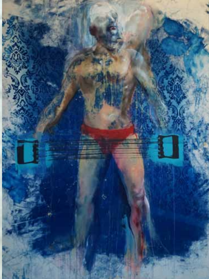
Ci-dessus Frédéric Royer, FIT , 2015, cyanotype sérigraphie et peinture acrylique sur toile, 120 X 165 cm