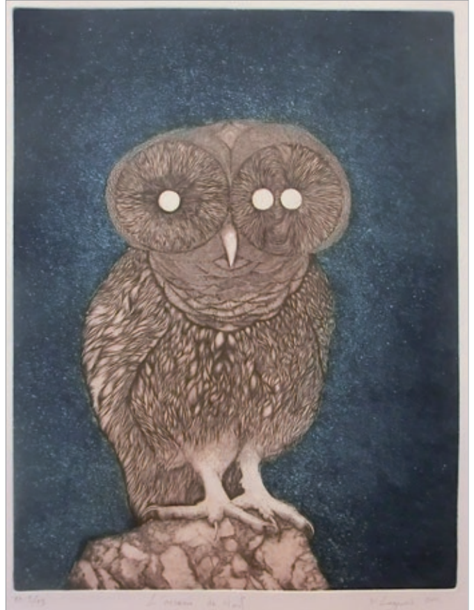
Yann Legrand, L'oiseau de nuit , 2011, Eau forte

Une créature allée se tient face à nous et nous observe de ses yeux vides... L'oiseau de nuit de Yann LEGRAND porte les attributs d'une chouette, mais a une bouche sous son bec et trois yeux blancs sur ses deux grands disques. Veilleur isolé au milieu d'une belle nuit bleue, cet oiseau clairvoyant serait-il une métaphore de l'inspiration nocturne de l'artiste ? Ce dont on peut être sûr, c'est que ce dessin gravé par un procédé de traits extrêmement fins, est le fruit de nombreuses heures de travail. Autre scène nocturne, les gravures de Michèle PELLEVLAIN qui représentent des puces géantes menaçant une figure féminine. Portant des titres évocateurs - La Revanche , La Fuite , Le Cauchemar - on comprend que ces images sont des allégories ; expriment par le biais d'une narration visuelle une idée, une situation. Dans un registre plus abstrait, Sécrétions enlacés de nuit de J.G GWEZENEG semble montrer un microcosme animal à l'état organique, entre vision onirique et imagerie scientifique.