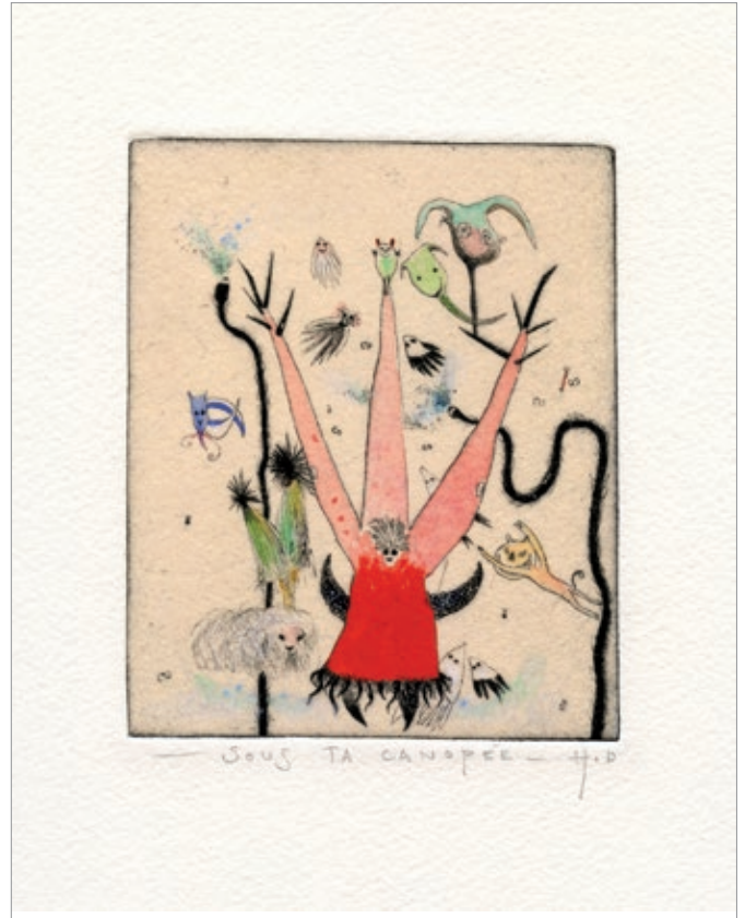
Didier Hamey, Sous ta canopée , 2009, Pointe sèche rehaussée

L'imaginaire de Robert COMBAS est délirant, généreux et coloré. Figure de proue du mouvement de la figuration libre (né au début les années 80), Il peint toutes sortes de figures et scènes fantastiques ou excentriques. Ici, des monstres verts un peu agités jouxent un dompteur de cirque coincé sur le bord de l'image. C'est peut-être le maître qui se fait déborder par ses propres animaux ? Autres créatures étranges, celles du « Bestiaire fabuleux » de Didier HAMEY . Dans cette série, il grave pêle-mêle végétaux, animaux et créatures imaginaires. Avec une once de candeur et beaucoup de gaieté, il nous plonge dans un monde miniature et carnavalesque.