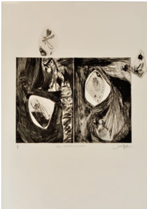
Joël Roche, Echappés de la plaque , Gravure