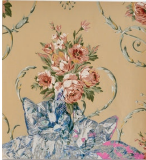
Lucille Dautriche, Croquette et Fripon , 2008, Dessin