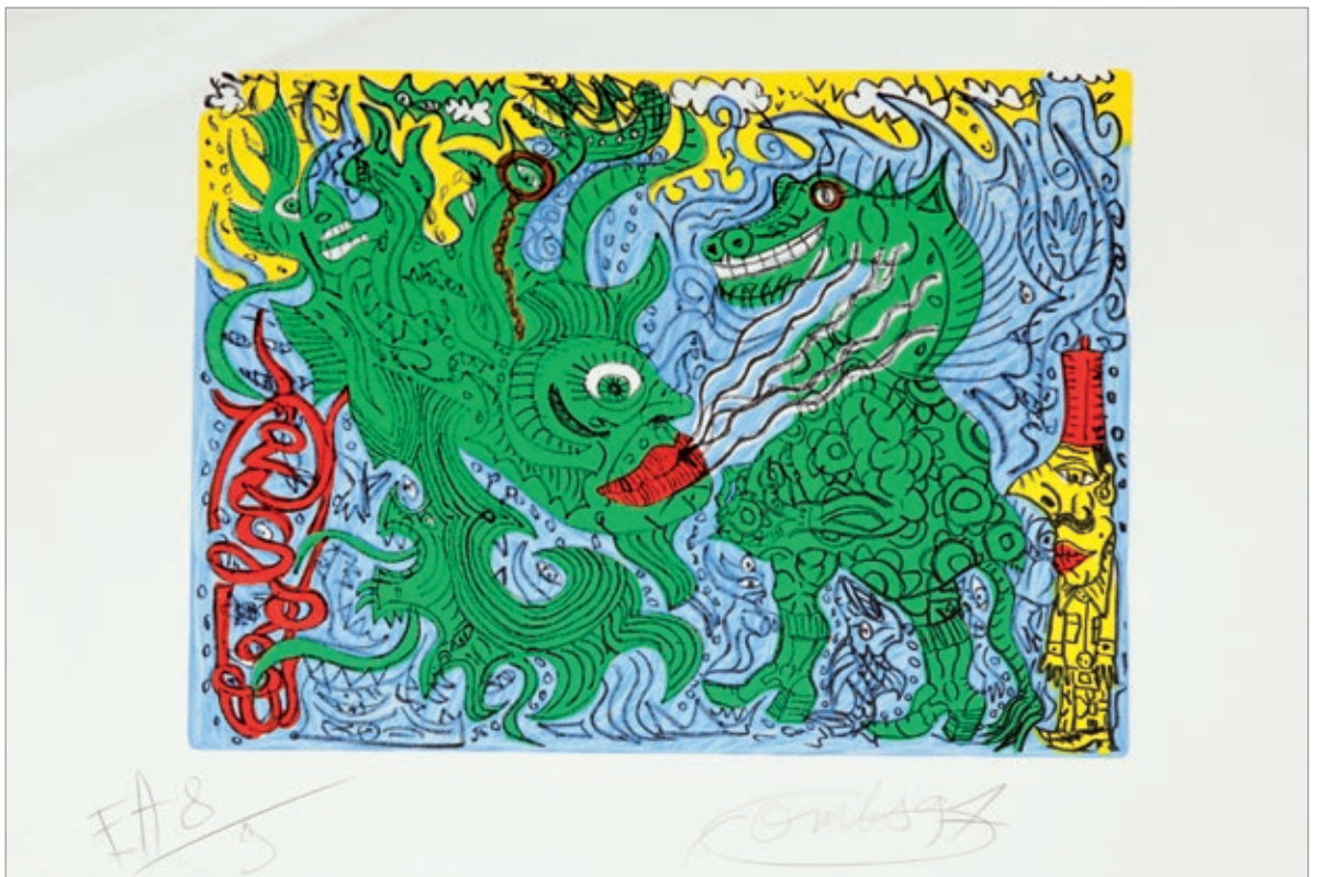
Robert Combas, Sans titre , 1997, Sérigraphie