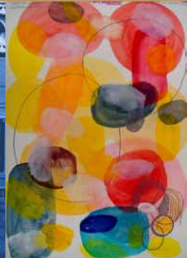
Ci-contre, de Haut en bas et de gauche à droite : photographie de V.Hubert, gravure de V.Dezeuze, Collage de L.Leblanc, photographie de P.Y.Brest, sérigraphie de J.Monory, Aquarelle de P.Dingwall