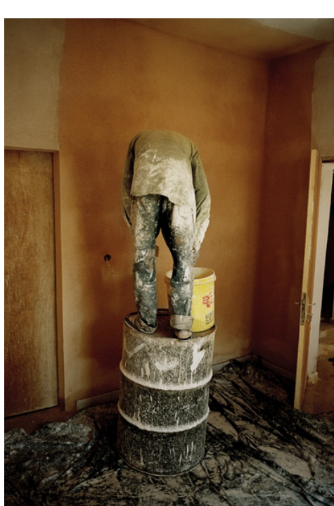
Sans titre (série Bamako s'apprête), photographie, 2009